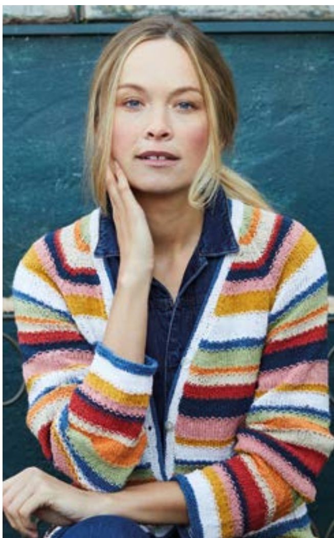
@ Lana Grossa GmbH, Gaimersheim, www.lanagrossa.de – photo : Sandra Brielmeier