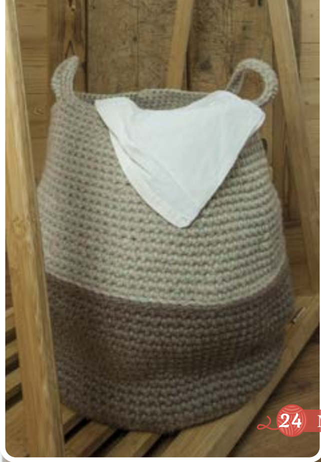
24 Modèle au crochet