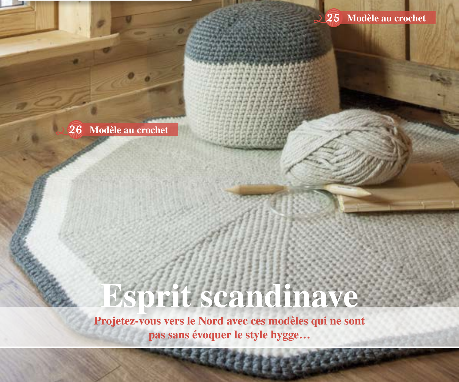
26 Modèle au crochet