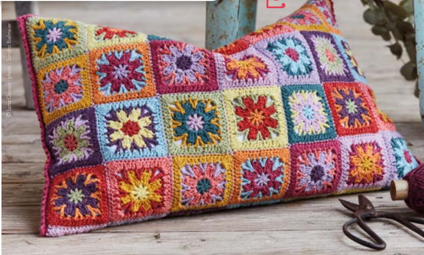
© Lana Grossa - photo : Sandra Bielmeier

Tout comme le plaid ci-dessus, ce coussin présente des grannys mais crochetés différemment. Ils sont également réalisés en travaillant en rond du centre vers l'extérieur. Le motif de fleurs, ainsi que la multitude de couleurs pastel qui ornent ce coussin en font un accessoire idéal pour décorer votre lit ou votre canapé !