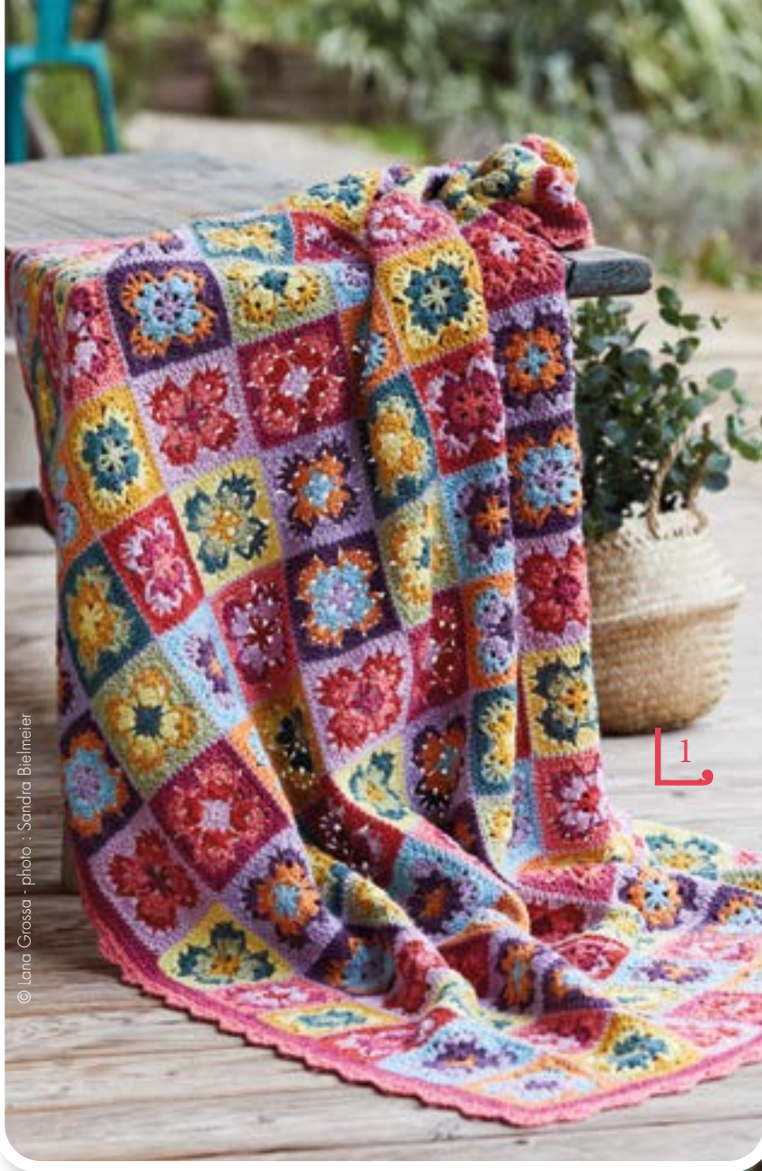
© Lana Grossa - photo : Sandra Bielmeier