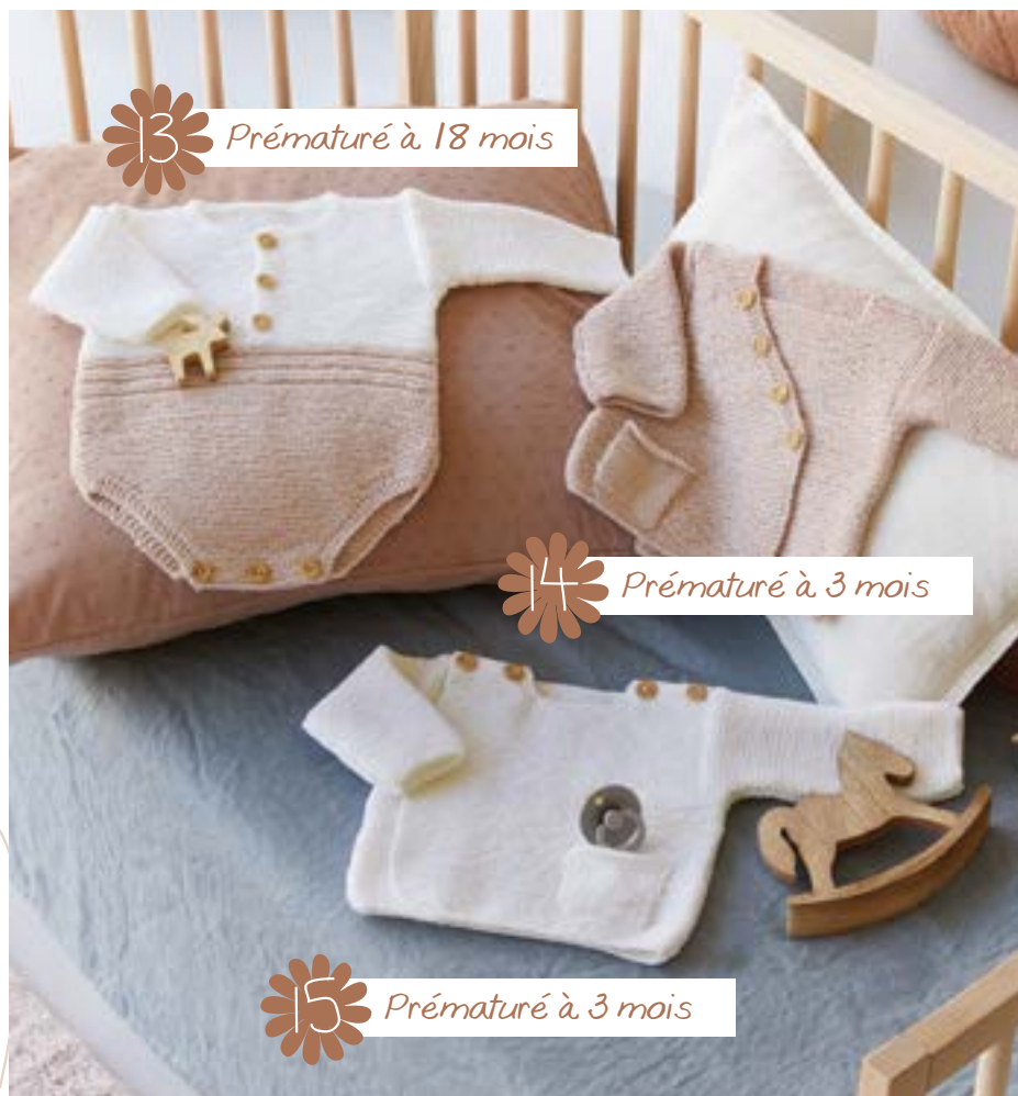
13 Prématuré à 18 mois