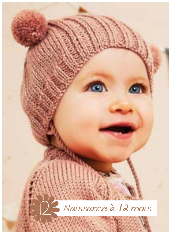
12 Naissance à 12 mois