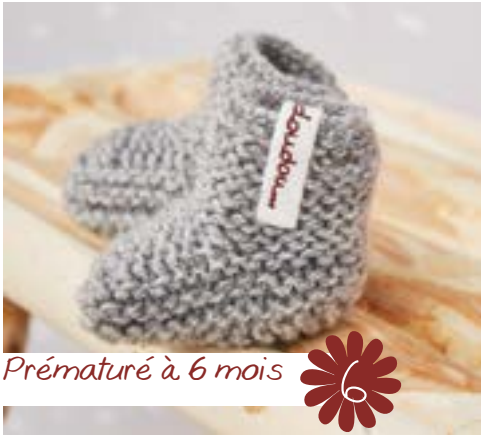
Prématuré à 6 mois