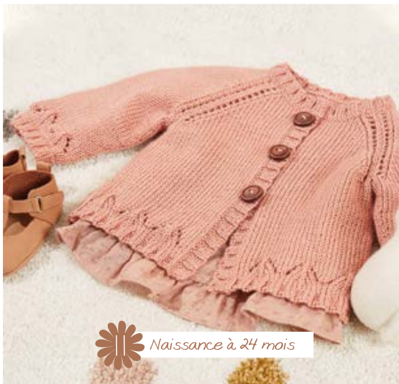
11 Naissance à 24 mois