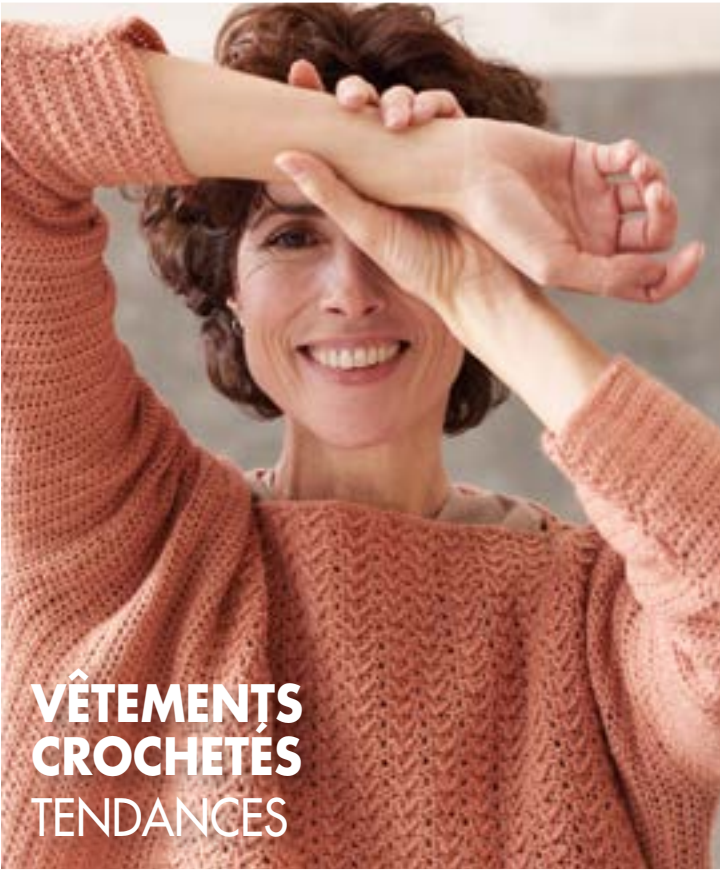
VÊTEMENTS CROCHETÉS TENDANCES

ideaa! Crochet créatif // Des modèles pour la nouvelle saison // ideaa!