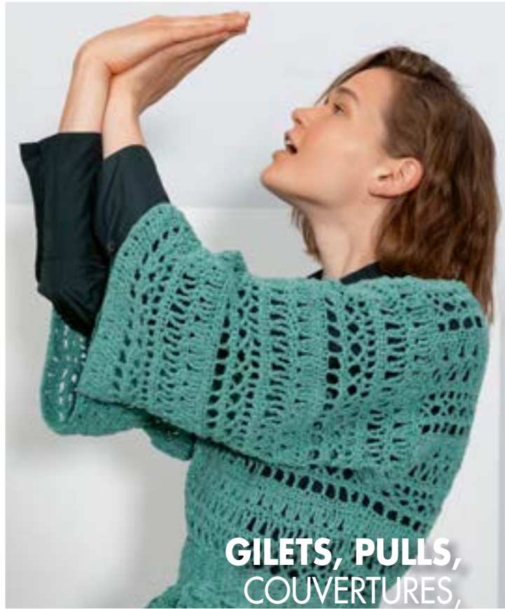
GILETS, PULLS, COUVERTURES, ACCESSOIRES, ETC.