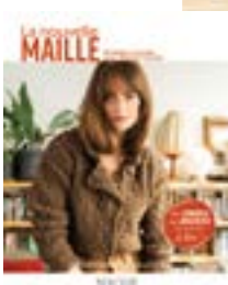
Ce modèle est extrait du livre « La nouvelle maille » de Bergère de France

Cette cape ne manque pas d'originalité avec ses torsades dont la largeur se réduit progressivement. Elle ravira les incondtionnelles des croisements de mailles ainsi que les amatrices de pièces uniques. Une grille vous guidera dans votre ouvrage et vous en donnera un bon aperçu.