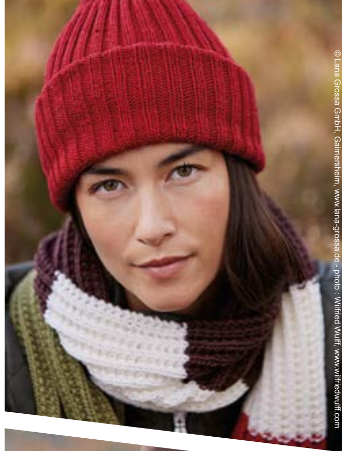
© Lana Grossa GmbH, Garmersheim, www.lana-grossa.de - photo - Wilfried Wulff, www.wilfriedwulff.com