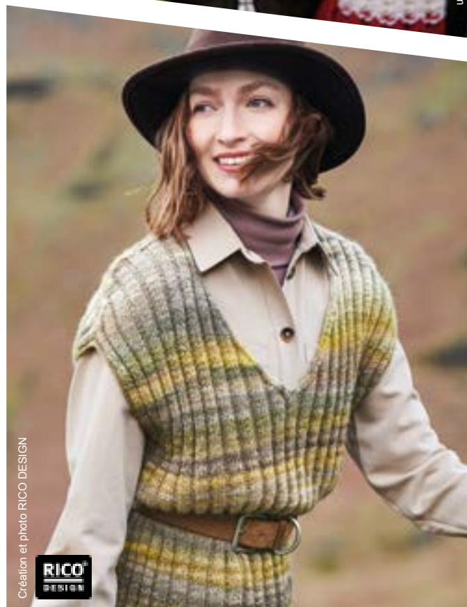
Création et photo RICO DESIGN