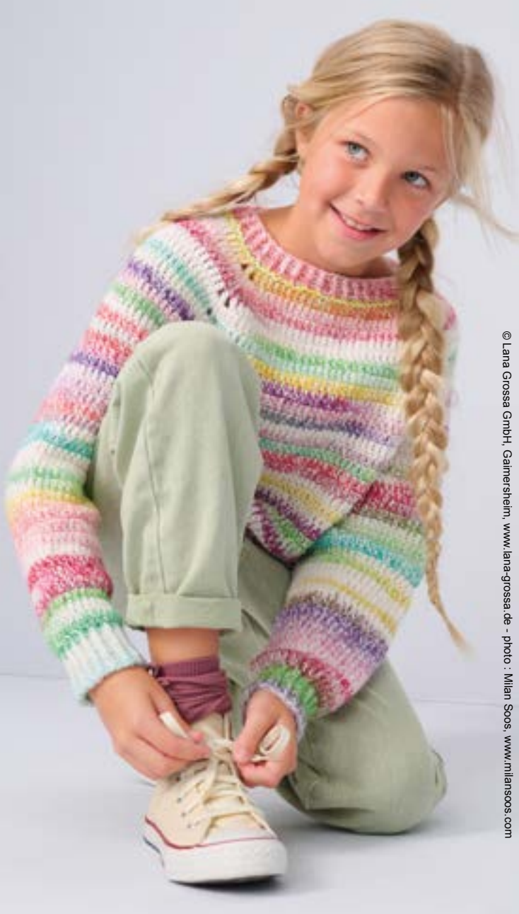
© Lana Grossa GmbH, Gaimersheim, www.lana-grossa.de - photo : Milan Soos, www.milansoos.com