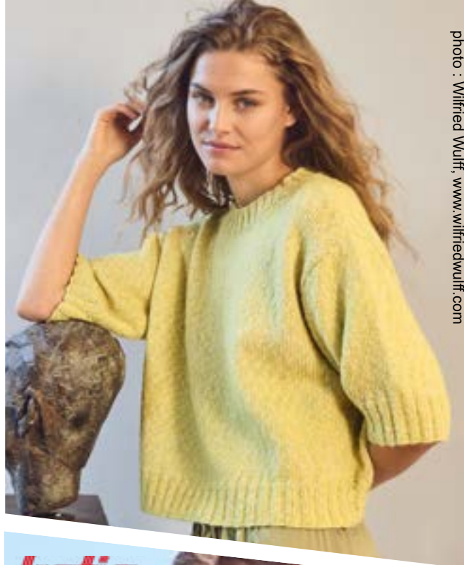
© Lana Grossa GmbH, Gaimersheim, www.lana-grossa.de - photo : Wilfried Wulff, www.wilfriedwulff.com