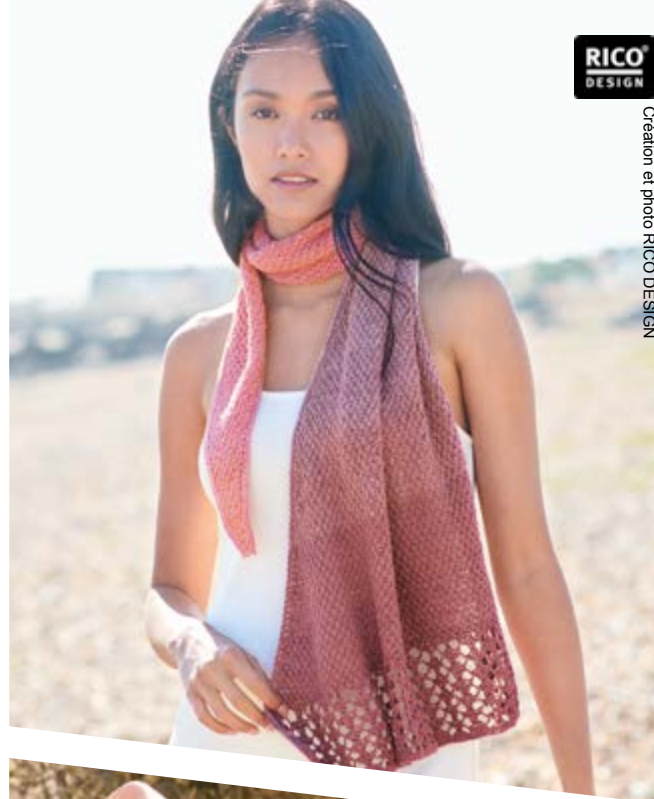
Création et photo RICO DESIGN